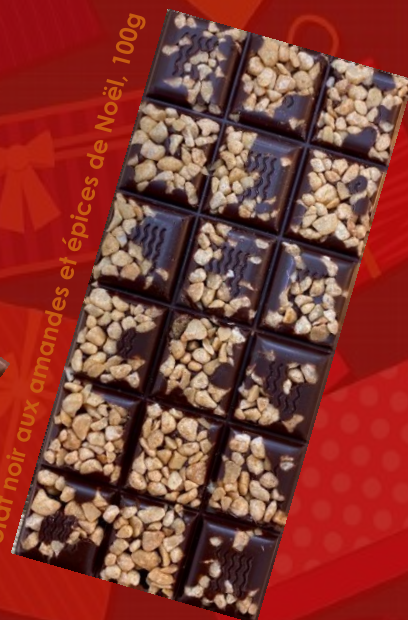
Chocolat noir aux amandes et épices de Noël, 100g

Commande à envoyer par mail à g.ramos@arfec.ch ou par sms au 078/ 885 35 32